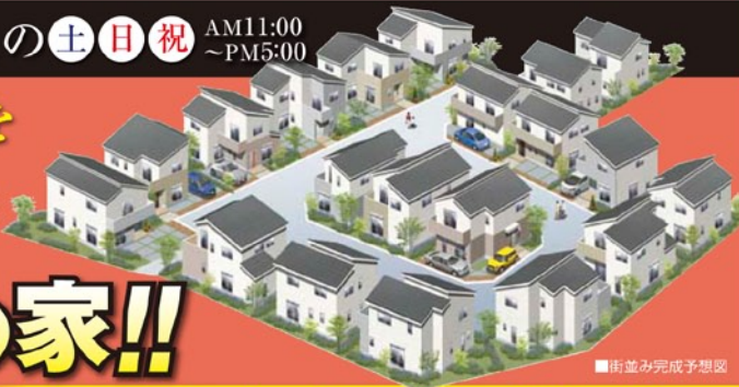
■街並み完成予想図